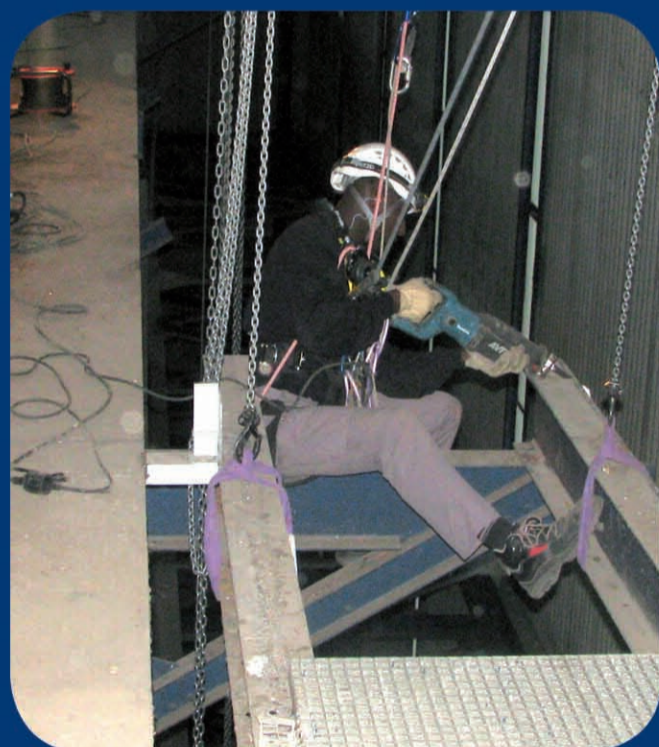
Des cordistes ont déposé la passerelle, à plus de 40 mètres du sol.