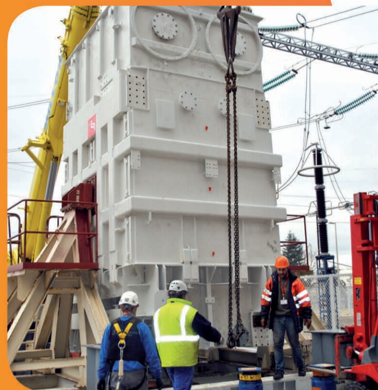
Un pôle de transformateur pèse près de 220 tonnes.

Un transformateur est constitué de 3 pôles pesant chacun 220 tonnes, accessoires et huile comprise (30 m³). Le rôle du transformateur principal est d'élever la tension à la sortie de l'alternateur de 24 000 volts à 400 000 volts, permettant ainsi le couplage de l'unité de production au réseau de transport d'électricité. Ce niveau de tension est requis pour faciliter la transmission de l'énergie produite par la centrale via le réseau Très Haute Tension.