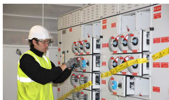
Tableaux électriques du bâtiment électrique