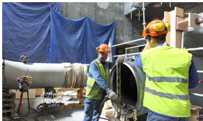
La formation, un axe prioritaire pour EDF

Un outil proposé par l'Etat, l'Engagement de Développement de l'Emploi et des Compétences (EDEC) a donné lieu à la signature d'un accord cadre par le Préfet, les Présidents du Conseil Régional et du Conseil Général, EDF, l'Union des Industries et des Métiers de la Métallurgie (UIMM), la Fédération Française du Bâtiment