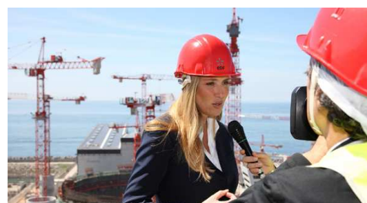
Visite du ministre italien de l'environnement