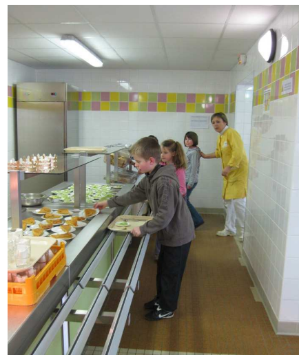
Restaurant scolaire réhabilité par le Grand Chantier

Le programme des actions de formation s'est poursuivi essentiellement sur les activités de métallurgie et de peinture industrielle et s'est conclu avec 94 embauches sur l'EPR.