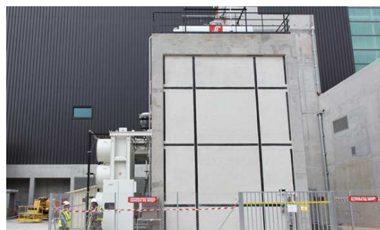
Casemate du transformateur auxiliaire

2011 sera marquée par le montage des chemins de câbles, des tableaux électriques et le tirage de câbles dans l'îlot nucléaire.