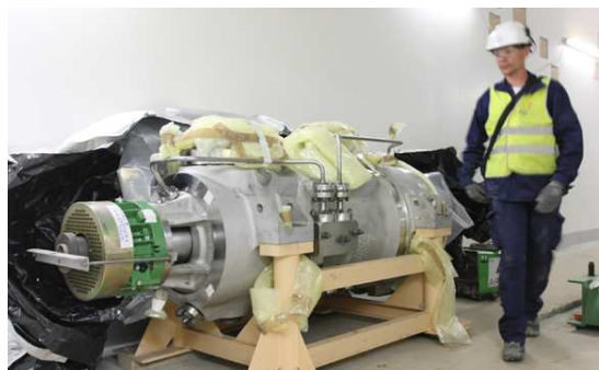
Une pompe RIS dans un des bâtiments de sauvegarde