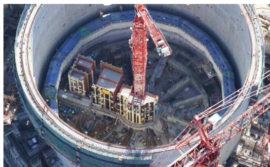
Vue aérienne du bâtiment réacteur

De plus, l'activité mécanique s'est accrue dans l'îlot nucléaire, notamment avec la mise en place des pompes RIS, permettant l'arrêt et le refroidissement du réacteur, ou en situation accidentelle, d'injecter de l'eau dans le circuit primaire. De nombreux supports de tuyauteries, châssis de pompes, gaines de ventilation ont également été mis en place dans les bâtiments de sauvegarde.