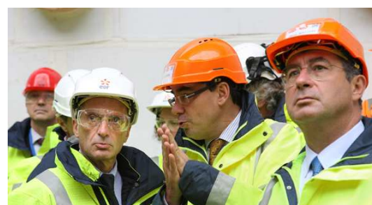
Visite de Henri Proglio, PDG d'EDF et de Martin Bouygues, PDG de Bouygues

Depuis l'ouverture du chantier en 2006, plus de 23 500 personnes l'ont visité dans le cadre de leurs missions ou activités professionnelles.