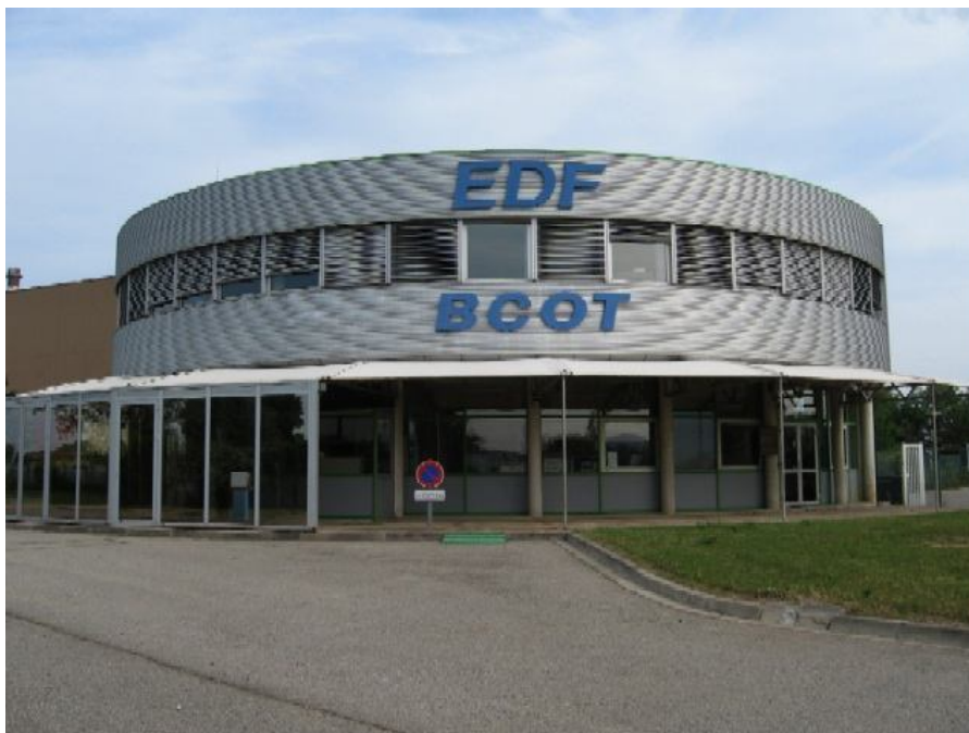
Le bâtiment d'exploitation de la Base Chaude Opérationnelle du Tricastin.

Cette INB exploitée par EDF est identifiée INB n°157 et son décret d'autorisation de création date du 29 novembre 1993 (publié au JORF le 7 décembre 1993).